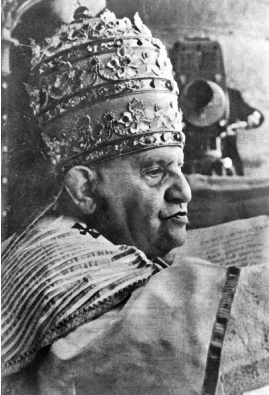
Giovanni XXIII benedice la folla dalla loggia di San Pietro il giorno dell'incoronazione (novembre 1958).